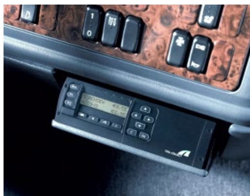
Grundig-Gerät, Einbau in einen DIN-Schacht.